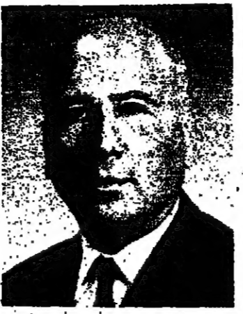
يقلم: الدكتور والتر ايتان

ومع هذا فإن الحكم الذاتي - الذي كان في الأصل من أجل أن يرضى عن الفلسطينيين - قد أصبح الآن في خطر. في ظل الظروف الحالية، فإن الحكم الذاتي قد أصبح الآن في خطر. في ظل الظروف الحالية، فإن الحكم الذاتي قد أصبح الآن في خطر. في ظل الظروف الحالية، فإن الحكم الذاتي قد أصبح الآن في خطر.